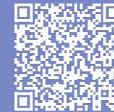
FILM Maschinenbau - Robotic Centre